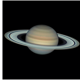
Planetaria y cometas